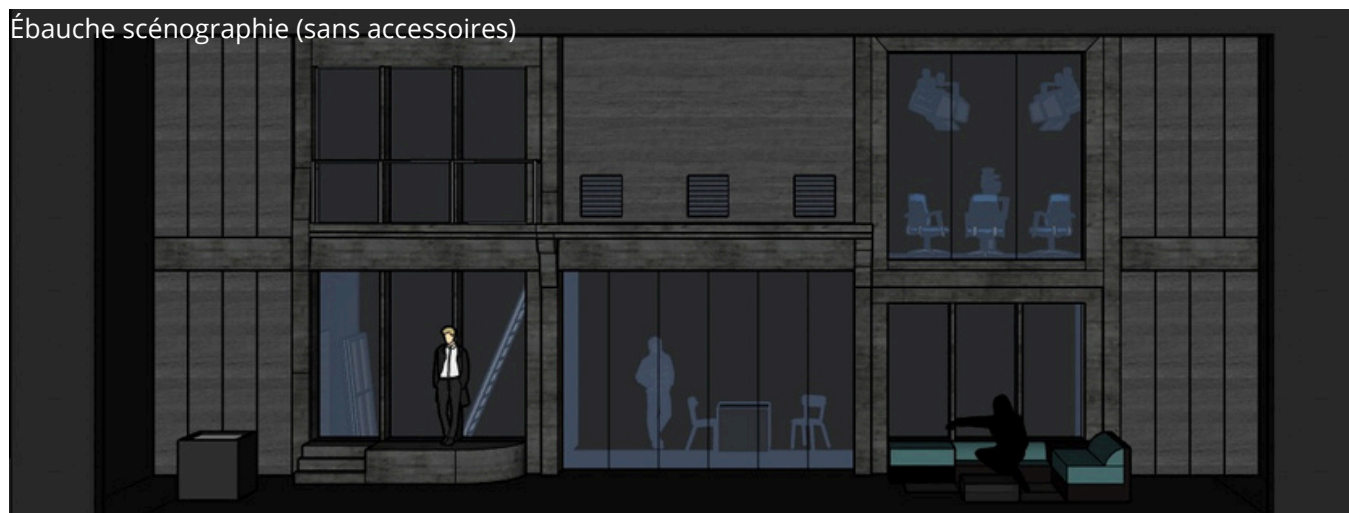
Ébauche scénographique (sans accessoires)

Au théâtre où l'on parle beaucoup de 4ème mur, cette opposition fenêtre/mur est très inspirante. C'est à partir de la tension dialectique qu'elle propose (qui est aussi la continuité du rapport figuration/abstraction) que nous avons imaginé ce décor vertical : un grand mur, comme l'arrière d'un théâtre, où s'encastrent des fenêtres ouvrant sur des espaces figuratifs, dans un jeu d'opacité et de transparence. Cette proposition l'a également emporté car l'espace devait permettre une simultanéité des situations, afin que nous puissions les suivre comme des plans séquences enchevêtrés. Ce continuum d'actions étant le geste principal de mise en scène, il était impératif de pouvoir passer d'un espace à l'autre avec beaucoup de fluidité, pour aller parfois jusqu'à la superposition.